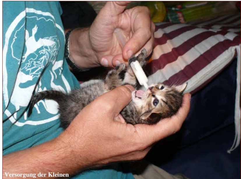
Versorgung der Kleinen

ungarischen Zollbeamten an der EU-Außengrenze gegenüberstehen. Noch einige Meter, und wir haben die